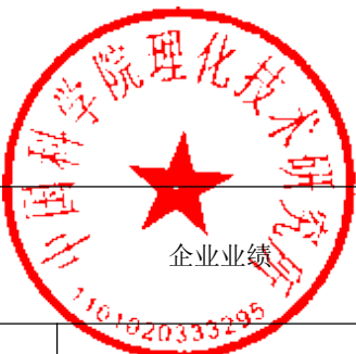
投标人商务信息公示表